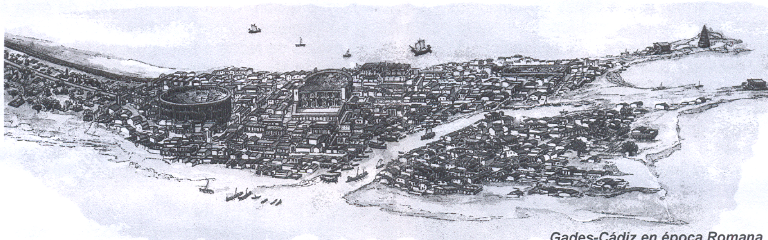
Gades-Cádiz en época Romana